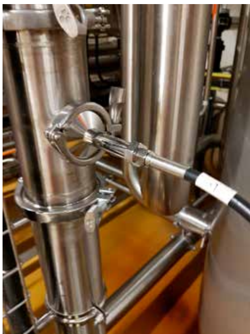
En nær-infrarød procesprobe indsat i en vandstrøm hos Arla Foods Ingredients.